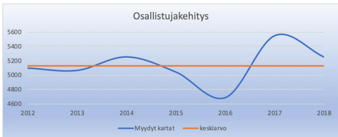
Taulukko 1. Kuntorastitapahtumien osallistujakehitys viimeisten vuosien ajalta.

Myytyjen karttojen kokonaismäärä oli 5248 eli n. 5 % vähemmän kuin kaudella 2017. Kun verrataan useamman vuoden keskiarvoon, oltiin kuitenkin keskimääräistä paremmalla puolella.