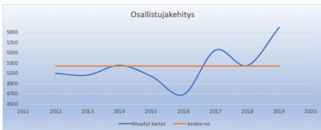
Taulukko 1. Kuntorastitapahtumien osallistujakehitys viimeisten vuosien ajalta.

Myytyjen karttojen kokonaismäärä oli 5997 eli n. 14 % enemmän kuin kaudella 2018. Tämä on uusi ennätys ainakin jos katsotaan tilastoja vuodesta 2012 lähtien.